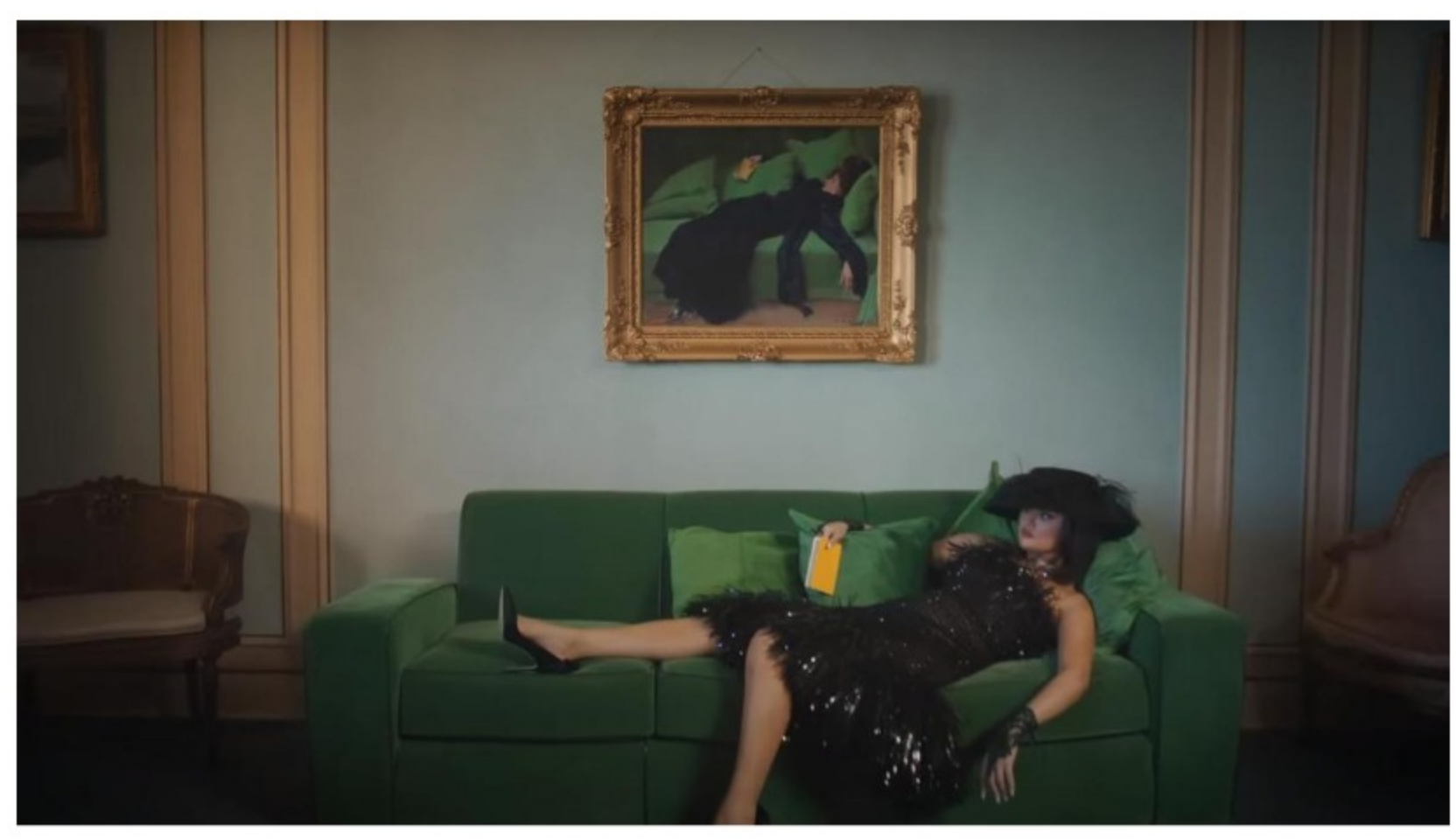
Selena Gómez al videoclip "Love on" on recrea el quadre de Ramon Casas

A l videoclip del nou tema de Selena Gomez , "Love on", hi ha un convidat bagenc. A la producció del tema que podria ser la targeta de presentació d'un possible nou disc, s'hi pot veure com la cantant nord-americana recrea la pintura "Jove decadent. Després del Vall (1899)" de l'autor barceloní modernista Ramon Casas (1866-1932), que s'exposa al Museu de Montserrat .