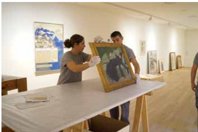
del ball o Jove decadent (1899), una simfonia de verds amb taca negra, que és una obra emblemàtica del millor Casas, de l'època de Pèl & Ploma .